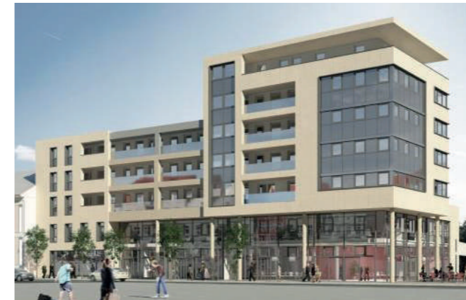
Das Postareal in Kehl am Rhein (Visualisierung: LEINBACH + BARTELS Architekten GmbH)

Die energiekonzept ortenau GmbH ist auf die Realisierung von Mieterstromprojekten und Energiecontracting spezialisiert. Im Postareal wurden zwei Blockheizkraftwerke von Senertec (jeweils 5,5 kW th ) und ein Spitzenlastkessel installiert, um möglichst viel des Strom- und Wärmebedarfs der Mieter im Haus abzudecken und die Energie direkt verkaufen zu können.