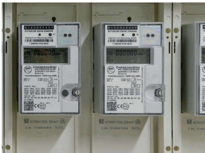
Discovery Smart Meter im Einsatz für die TWS

TWS erweitert Produktportfolio um intelligenten Messstellenbetrieb