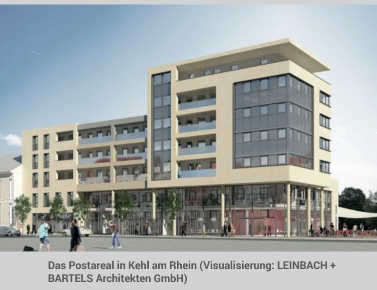
Das Postareal in Kehl am Rhein (Visualisierung: LEINBACH + BARTELS Architekten GmbH)

Es ist ein nobler Gebäudekomplex, der nun das architektonische Bild von Kehl am Rhein prägt. Das Penthouse im 7. Stock des Postareals lädt zum atemberaubenden Blick Richtung Straßburg ein, weiter unten erfreuen sich die Einwohner an zusätzlichen Einkaufsmöglichkeiten. Zu den 61 Mietern der drei Häuser gehören auch eine Bäckerei, die Postbank und ein Hörgeräteakustiker. Das Postareal macht auch energetisch eine gute Figur: Es ist eines der besten Mieterstromprojekte Deutschlands.